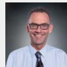
Alexander Fischer Dunkermotoren GmbH